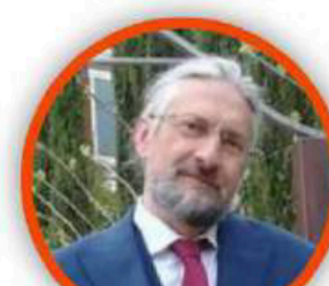
MASSIMO TAVOLA SECONDARIA DI PRIMO GRADO